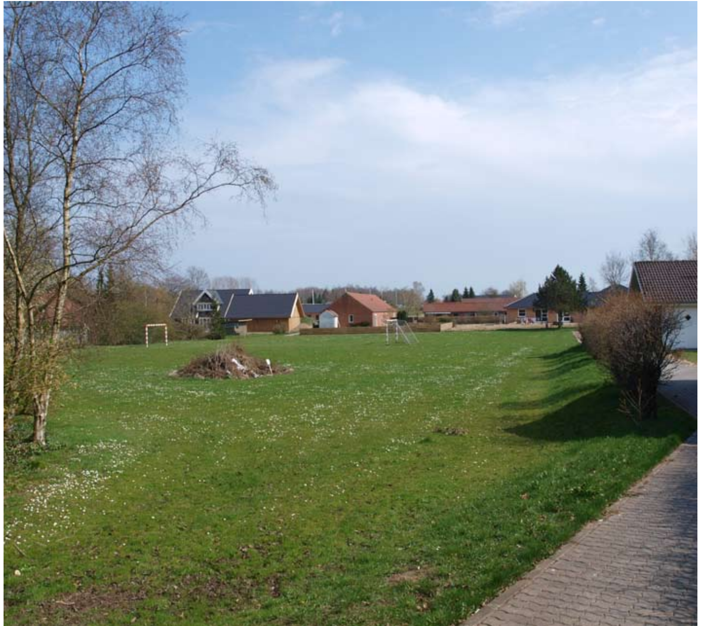
Rekreativt område i stationsbyen