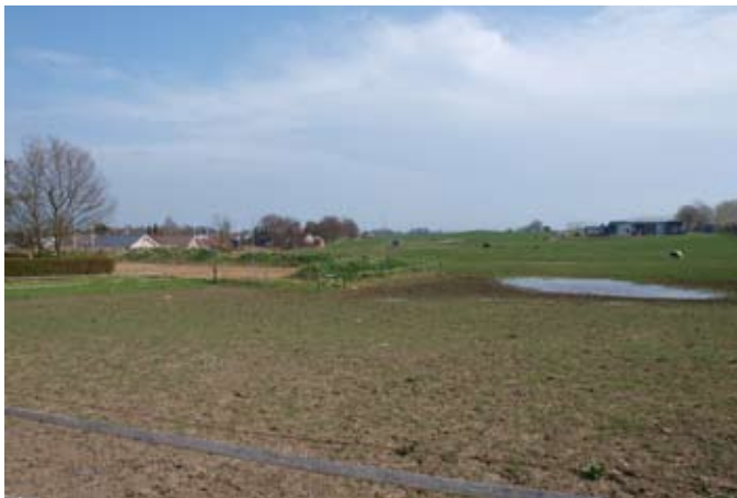
Eng med heste