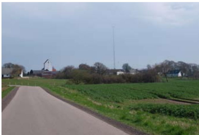
Kig mod kirke