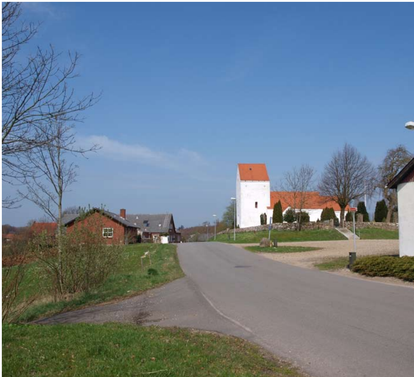
Kig mod kirke