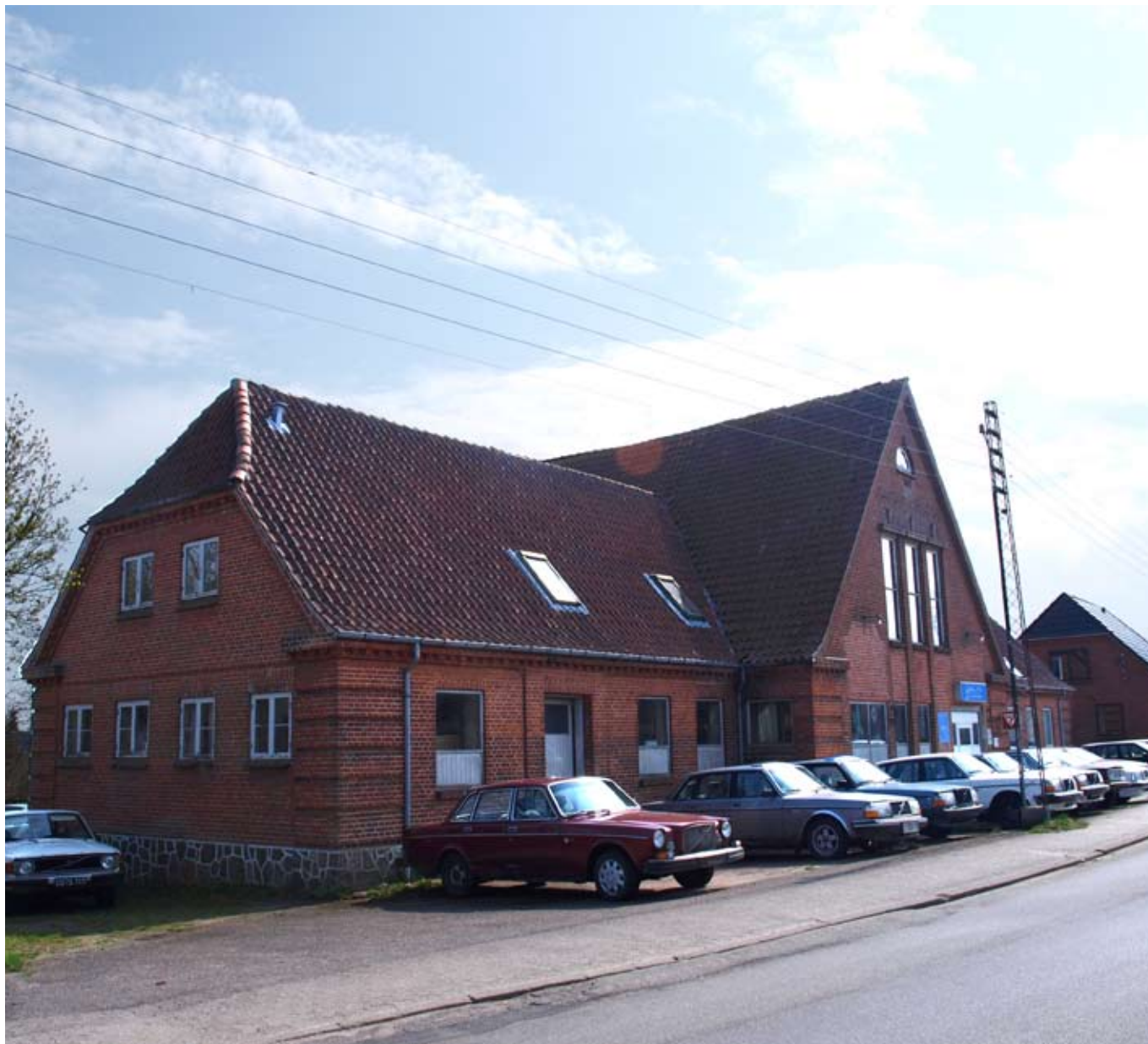
Volvoreservedelsforhandler i Langgade